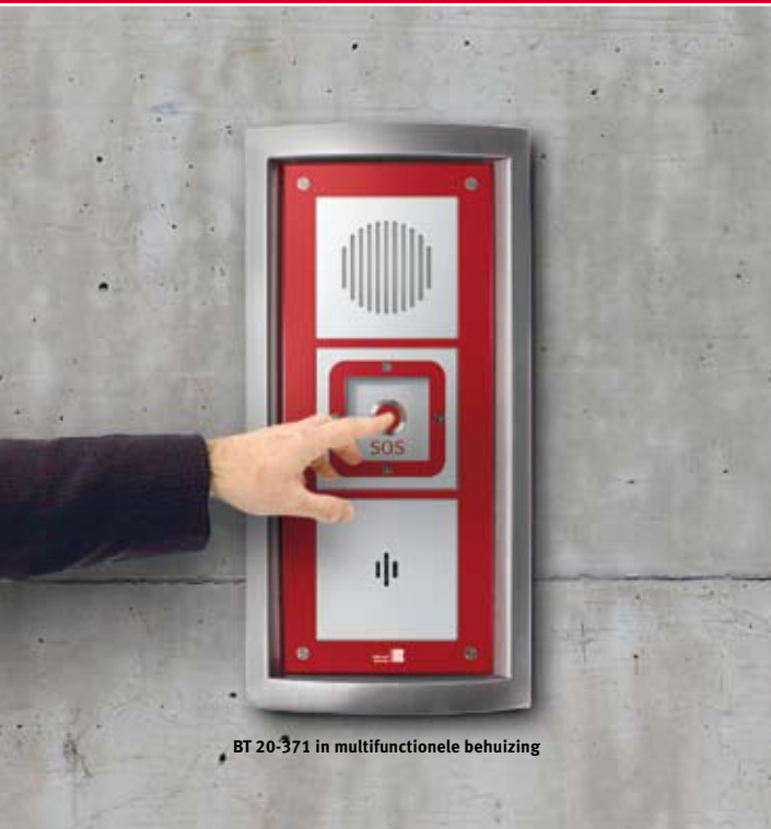
BT 20-371 in multifunctionele behuizing